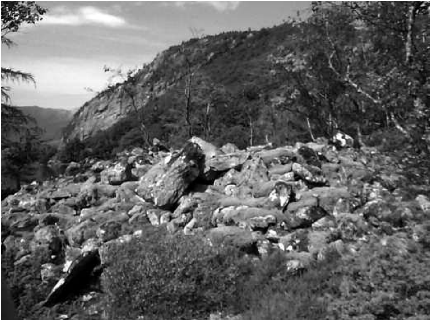
Gravrøys på Solnes, Ytre fjord. Mot nordaust med Raudeberget bak