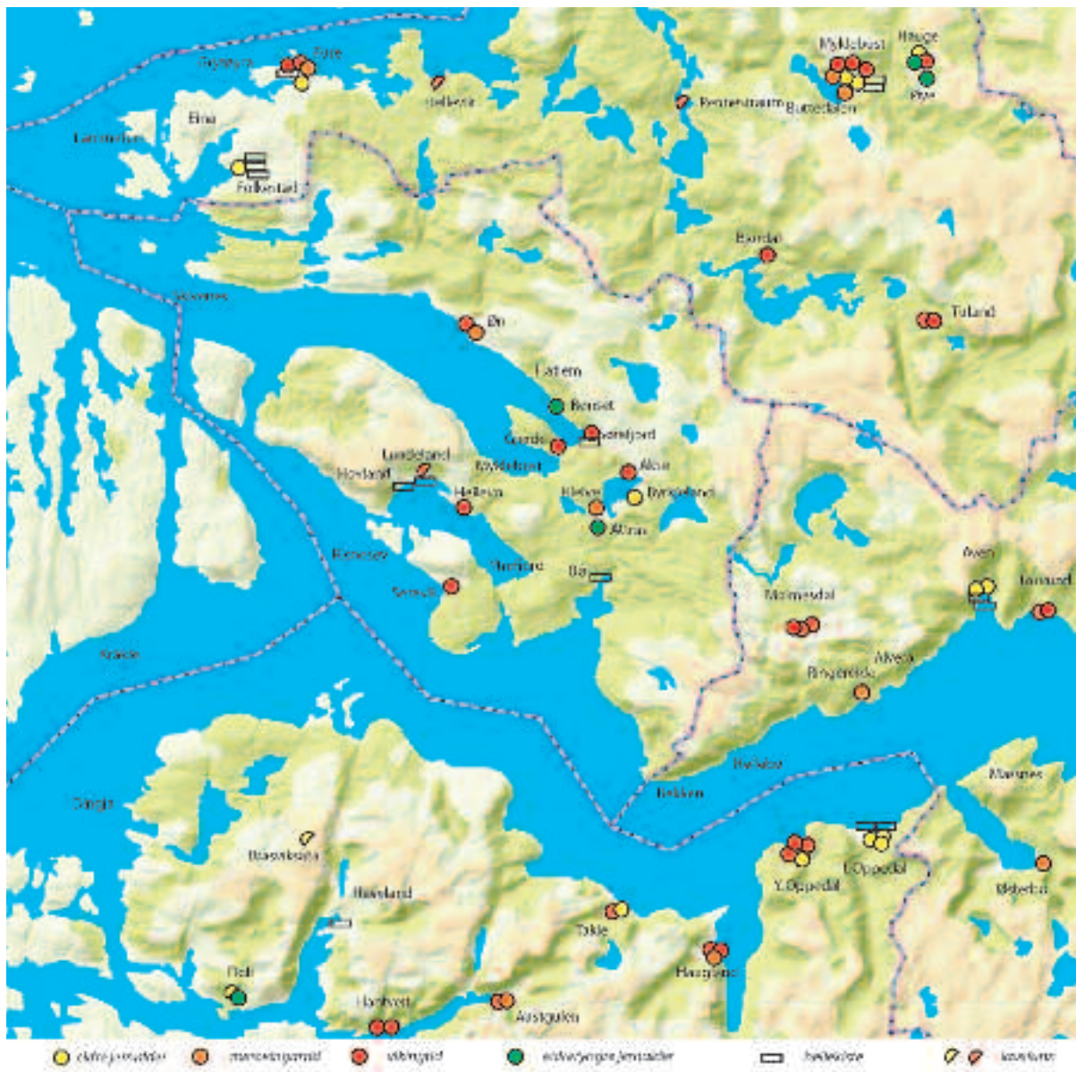
Fig. 2. Funn frå jernalderen i Hyllestad og områda rundt.