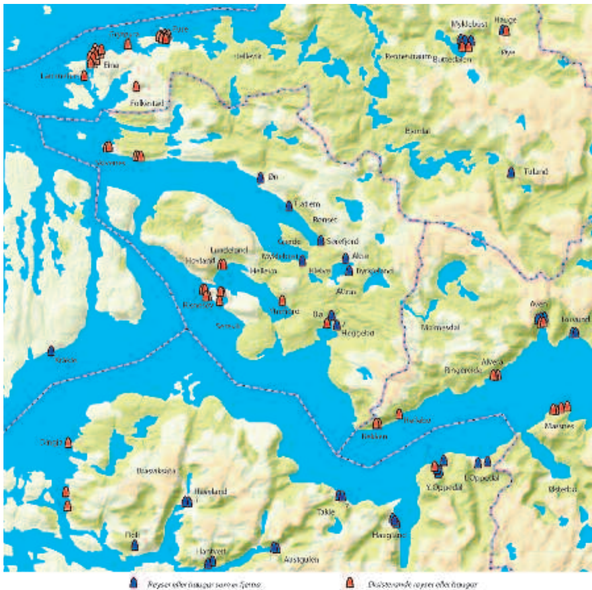
Fig. 3. Eksisterende og fjerna gravhaugar/-røyser i Hyllestad og områda rundt.